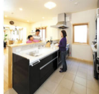
コミュニケーションを重視したフルオープンキッチン。家族間によっての会話の場となる。