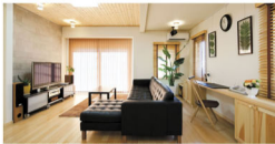
開放的なキッチン・ダイニング・リビング。奥まで行き渡るバーカウンターが、開放感を演出している。