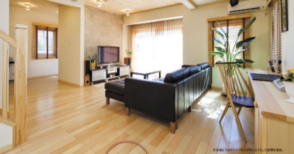
写真左側より右へリビング・ダイニング・キッチン・キッチン・キッチン