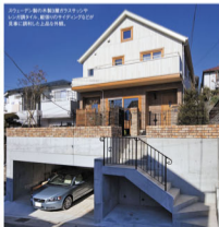
ポスターン製の木製3層ガラスサッシが上品な雰囲気を醸し出す外観。家族それぞれの想いを叶えた室内空間は開放的でナチュラルな空気に包まれている。